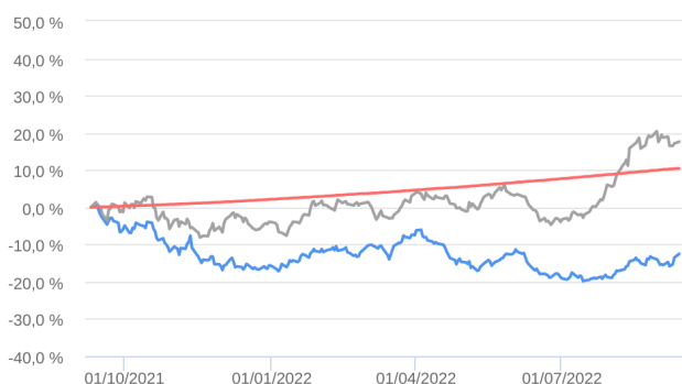
Retorno Acumulado - 13/09/2021 a 12/09/2022 (diária)